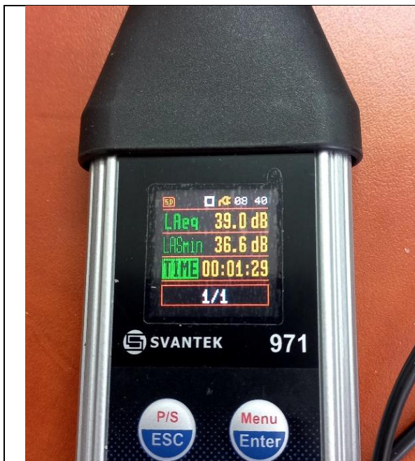
רעש רקע 39.0