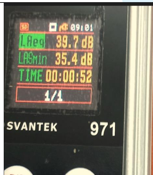
רעש רקע 39.7