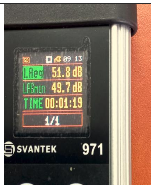
מדידת רעש מדחסים 51.8