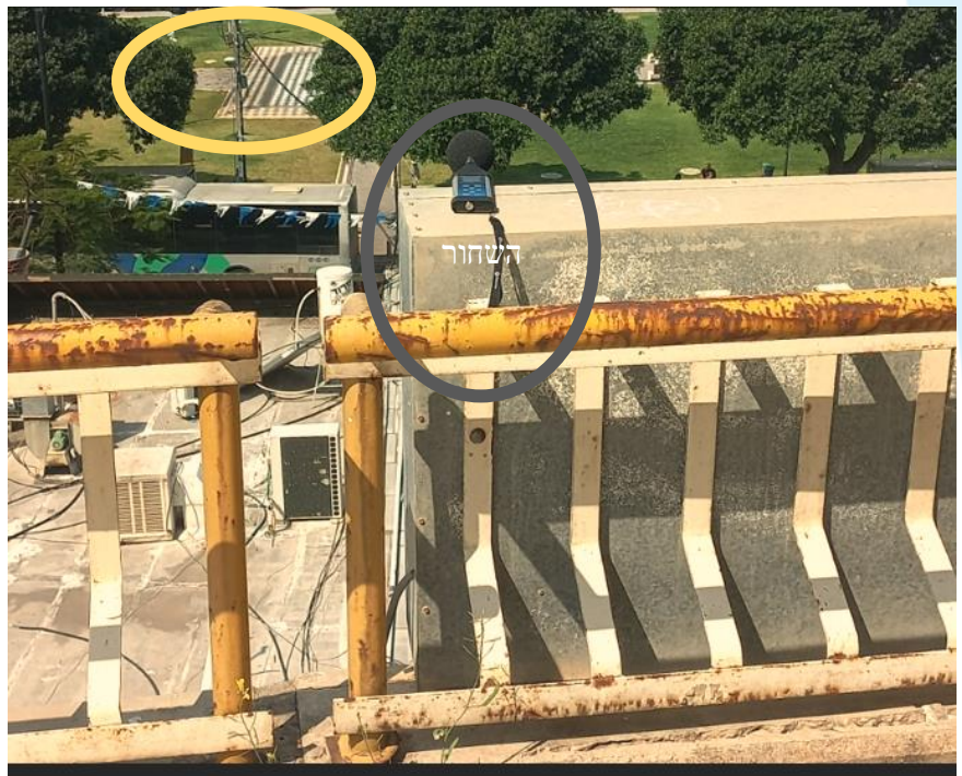
מד הרעש במרכז העיגול השחור, המזרקה במרכז העיגול הצהוב